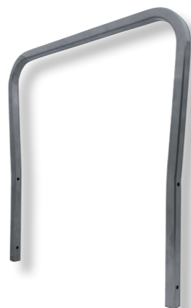
Gebogen en bewerkte vierkante koker buis tbv nierdialyse stoelen