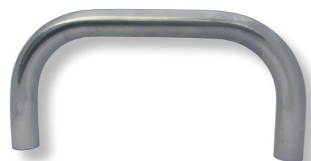
Buisrail kopstuk tbv buisrail verwarming

Zowel enkel stuks als grote series buigwerk kunnen wij snel realiseren. De meer gespecialiseerde buisvormen, met een grote radius, worden door ons vakkundig gewalst.