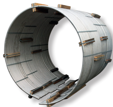
Slangenhaspel tbv maritieme industrie