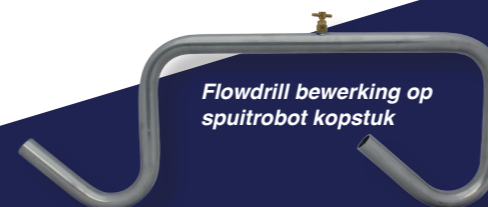
Flowdrill bewerking op spuitrobot kopstuk

Uiteraard staat een perfecte uitvoering van de bewerkte buis voorop. Zelfs als deze in het eindproduct niet zichtbaar meer is.